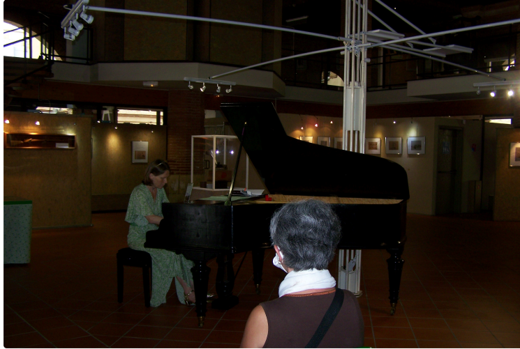
Exposition estivale et Nuit des Musées animent le Musée Campanaire-Espace Pierre Lasserre