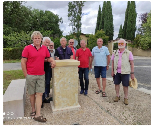
Les acteurs de la mise en place de la statue