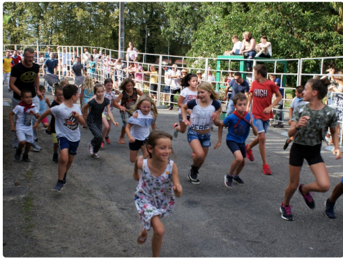
le petit "encierro" pour les enfants

Bien entendu ces festivités auront lieu dans le respect des conditions sanitaires en vigueur.