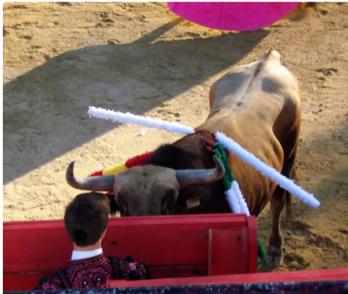
" Ton œil noir me regarde"