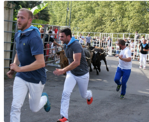
le grand "Encierro" pour les grands