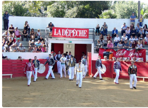
l'entrée de la Couse Landaise et la "Cazérienne"