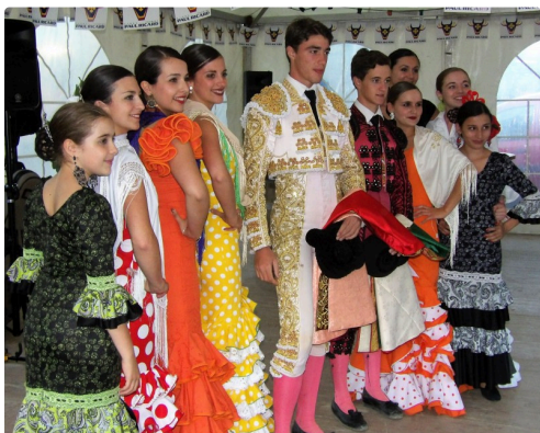
Fiesta y Alegria aux fêtes plaisantines