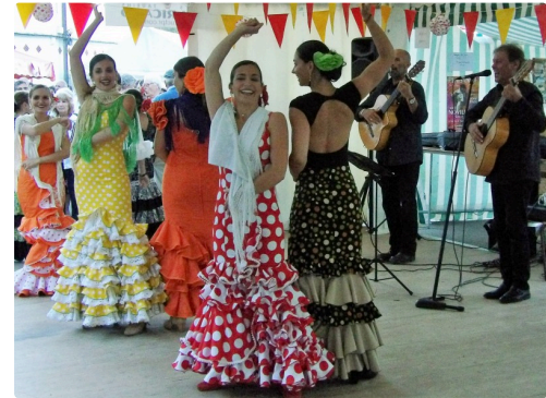
Danses et Chansons avec "Paco y Paco"