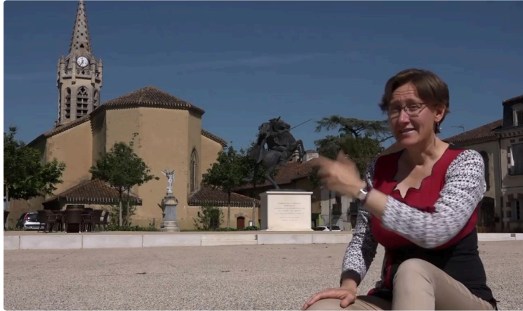
" Baludio " Laissez vous guider à travers le Gers