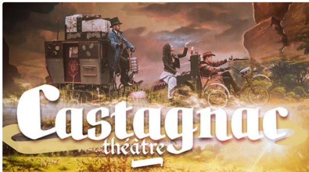
En avant-première, une déambulation dans le cadre de Vineart 2021

Un spectacle gratuit et une exclusivité coproduite par La Boîte à Jouer