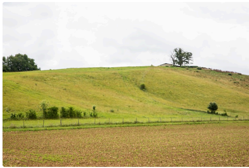
Prairie de la région Castelnavet - Saint-Pierre-d'Aubézies