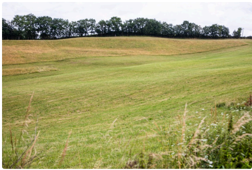
Prairie de la région Castelnavet - Saint-Pierre-d'Aubézies