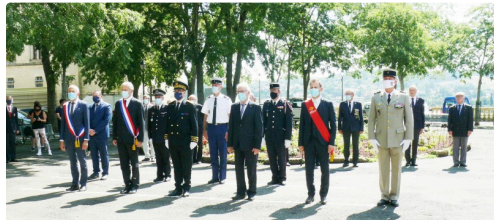
Les autorités civiles et militaires.