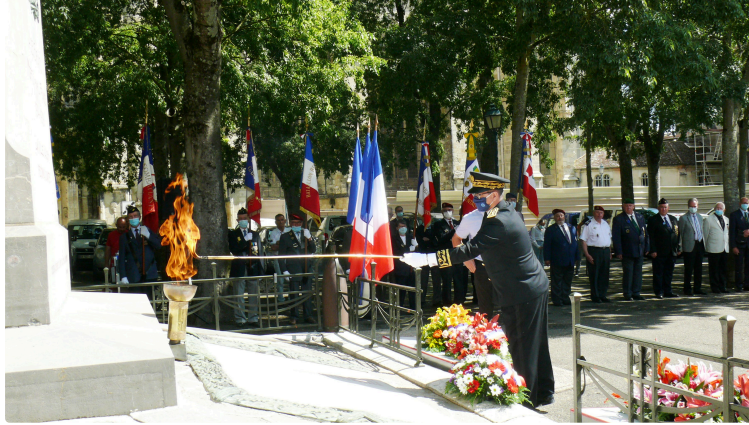
Commémoration de l'appel du 18 juin 1940

A l'occasion du 81ème anniversaire de l'appel à la résistance du Général Charles de Gaulle lancé depuis Londres le 18 juin 1940, une cérémonie s'est déroulée vendredi matin au monument aux morts d'Auch. Il s'agissait de se souvenir de l'appel lancé sur les ondes de Radio-Londres où le Général de Gaulle appelait les Français à refuser la défaite et à poursuivre le combat aux côtés de nos alliés Anglais qui résistaient vaillamment aux armées hitlériennes.