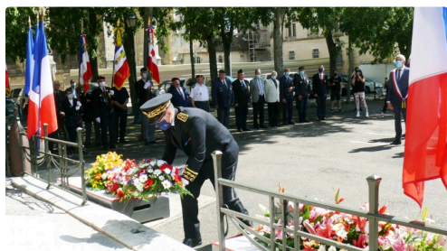
Dépôt de gerbe par le préfet du Gers, Xavier Brunetière.