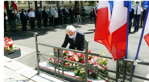
Dépôt de gerbe par le sénateur Alain Duffourg.