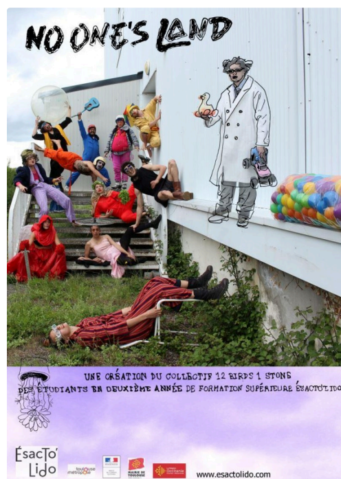
No one's land ©Esacto'Lido.jpg

Entre deux mondes est une pièce pour 5 danseurs acrobates et 1 chanteuse/comédienne, qui mêle le chant, la magie nouvelle, la danse verticale et la voltige. Telle une petite humanité, ce groupe se retrouve embarqué dans une épopée acrobatique et lyrique à travers le temps. Dans un monde qui bouge et les repousse, le collectif s'adapte, tente de garder l'équilibre avant que tout bascule. Une histoire de place, de liens, de gravité.