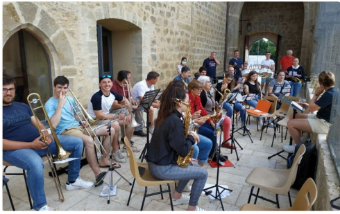
BANDA MARCIAC 6.JPG