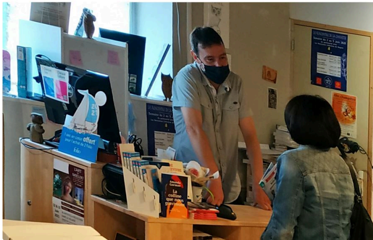
Les Rencontres Littéraires de Nogaro: c'est aussi à Marciac.