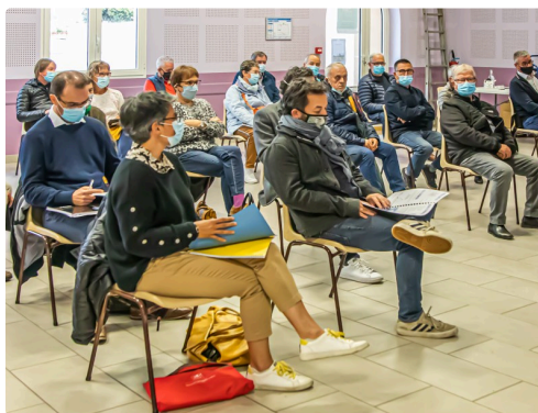
Dans la salle de réunion de l'assemblée générale