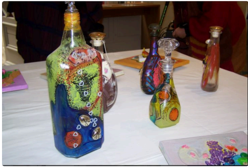
Quelques objets peints à sa façon