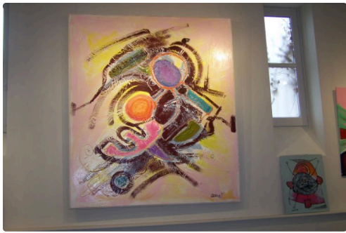
Une de ses oeuvres