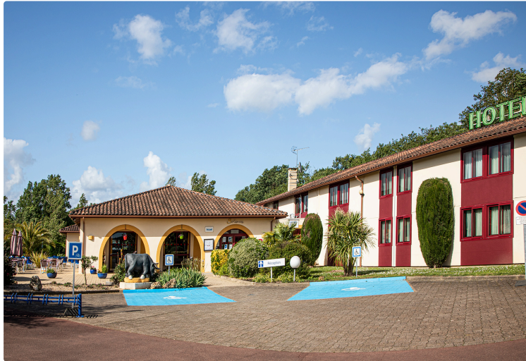
Réouverture de l'hôtel-restaurant Solenca (Nogaro)