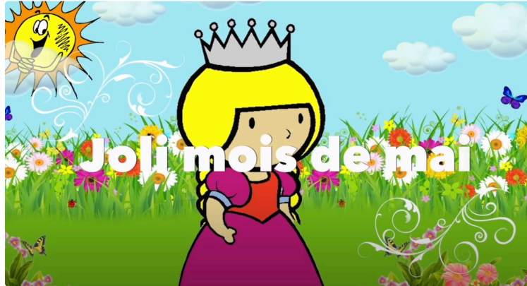
En mai, fais ce qu'il te plaît !

Mais attention car la tique est là, elle sort de sa léthargie hivernale et elle cherche à se nourrir. Pour elle, le promeneur est une proie idéale.