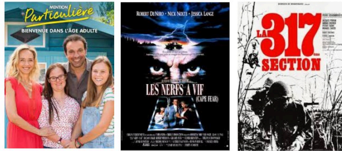
Téléfilm dramatique, thriller et film de guerre lundi soir

Un téléfilm dramatique, un thriller et un film de guerre pour votre soirée de lundi.