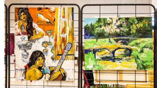
Tableaux de Pim Harren