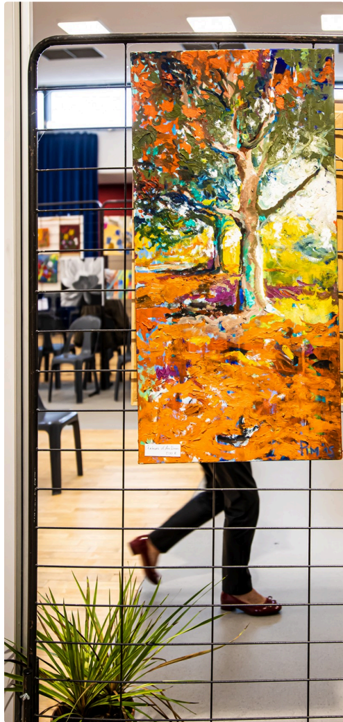
Tableau de Pim Harren