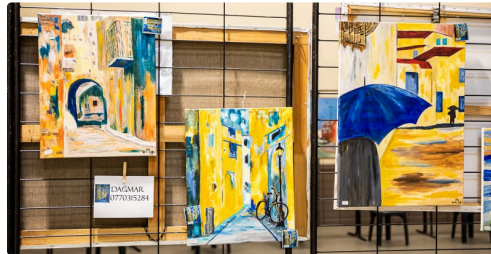
Tableaux de Dagmar Bünemann