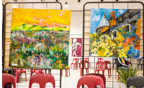
Tableaux de Pim Harren