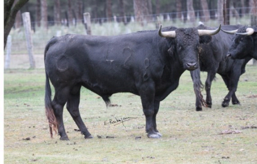
Toros en Vic : novillada de samedi 10 juillet

Le Club Taurin vicois présentera lors de Toros en Vic de juillet un lot exceptionnel de toros "à la vicoise" qu'affrontera un très beau cartel.