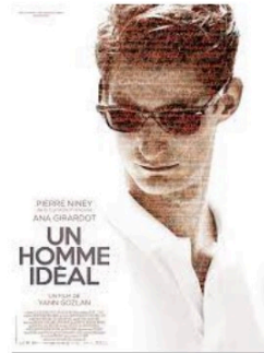
Le film 5 fois nommé aux Oscars ou un thriller à la Hitchcock mardi soir

Un biopic cinq fois nommé aux Oscars, un thriller et un documentaire sur l'école à la maison à vous proposer pour votre soirée de mardi.