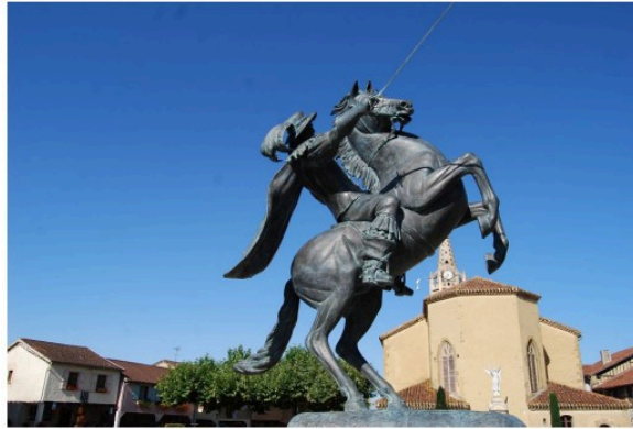
Après la télévision, le cinéma ! D'Artagnan, le héros local, de nouveau à l'honneur

Le docu-fiction diffusé sur Arte samedi 10 avril et encore disponible en cliquant ici , avait mis en lumière le véritable d'Artagnan qui a inspiré à Alexandre Dumas son héros de fiction.