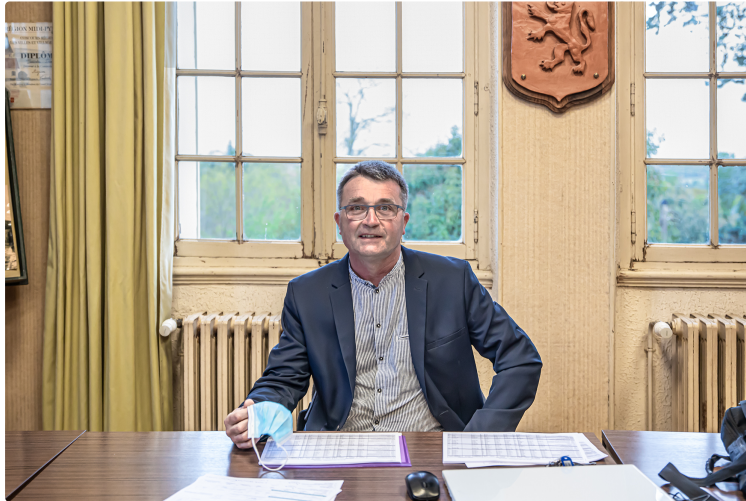
Un budget pour une année 2021 qu'on espère normale en 2021 à Aignan

Le chantier de la rue Saint-Saturnin semble enfin pouvoir être concrétisé