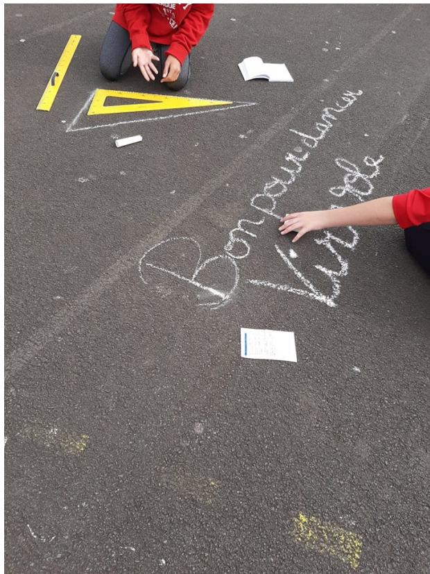
"Scalène" en cours de réalisation