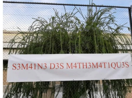
La semaine des mathématiques en plein Océan Indien !

La semaine des mathématiques a lieu tous les ans depuis 10 ans dans les écoles, collèges et lycées.