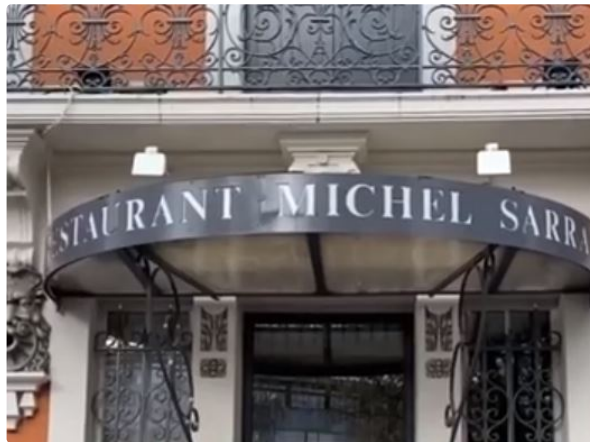
Gers Développement lance sa chaîne de podcasts