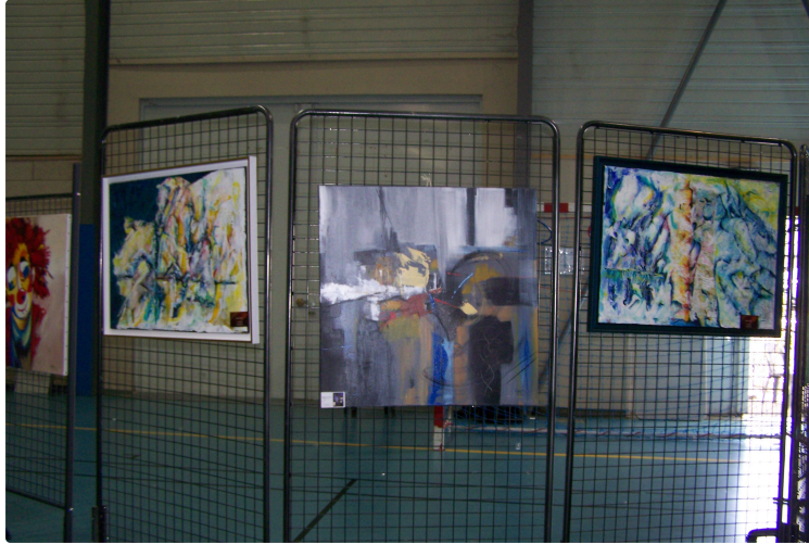
Jeux de couleurs pour passer le temps !