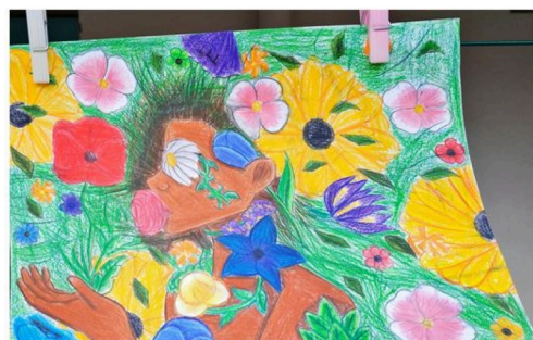
grande lessive marciac 3b.JPG