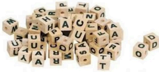
Solution des jeux du week-end

Alors, combien de carrés avez-vous comptés ?