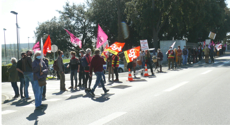
Sud Solidaires et CGT rejettent la réforme de l'assurance chômage

Ils étaient une cinquantaine mercredi 23 mars en matinée devant les locaux de Pôle emploi, pour d'autres une centaine, peu importe cela désolé Jean-Louis et Angel entre autres qui se posent la question « mais où sont les chômeurs alors que cette manifestation les concerne particulièrement puisque la réforme de l'assurance chômage va baisser leurs indemnités ».