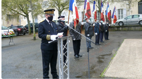
Lecture du message ministériel.