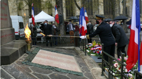
Ravivage de la flamme.