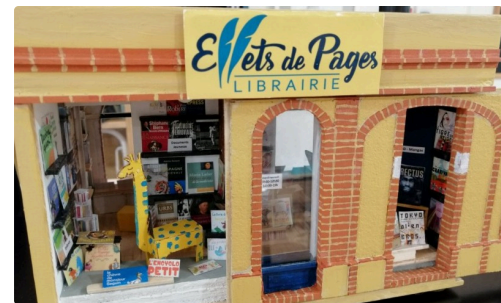
EFFETS DE PAGES.jpg