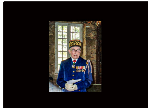
Lors d'une remise de décoration - Photo communiquée par Bertrand de Pesquidoux