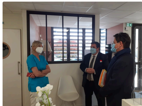
A l'intérieur du Cabinet dentaire