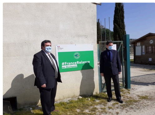
Base de loisirs