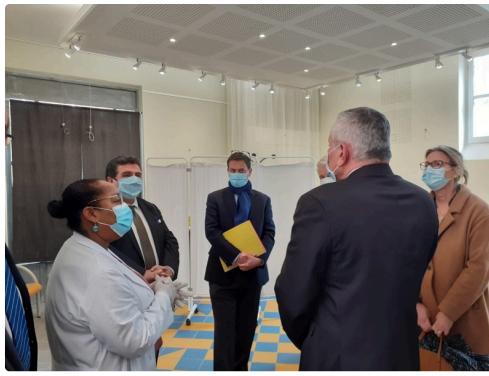
Centre de vaccination