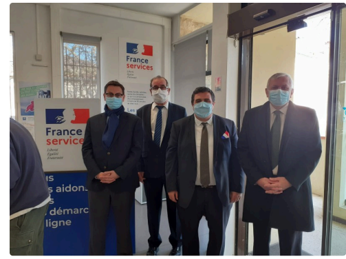
Les élus à la Poste