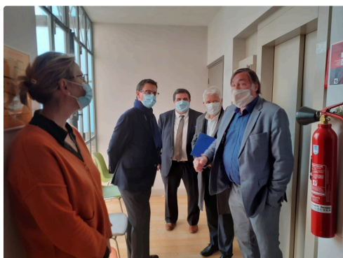
Centre de santé