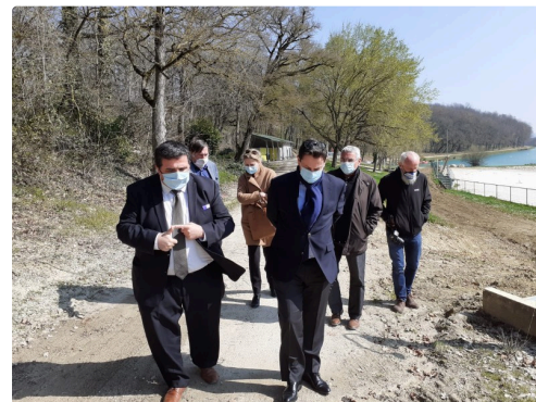
Base de loisirs