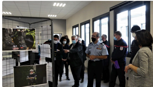
visite de l'exposition photographique