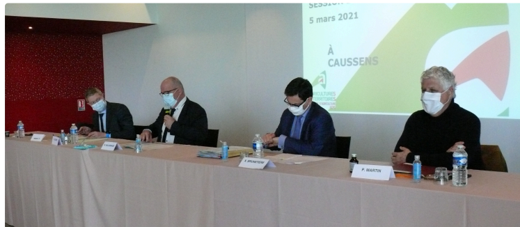
Le virus HP H5N8 met-il à genoux la filière gras