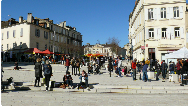
La surprise du piéton