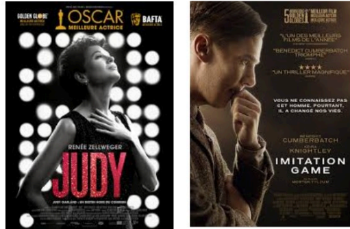
Que regarder à la télévision mardi soir?

Deux biopics, un film d'animation et, une fois n'est pas coutume, un documentaire à vous suggérer pour votre soirée de mardi.