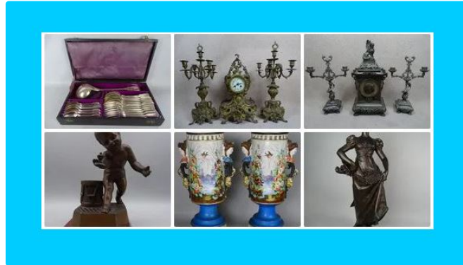
Amateurs de bijoux, une matinée pour vous

La prochaine vente aux enchères en comporte un grand nombre