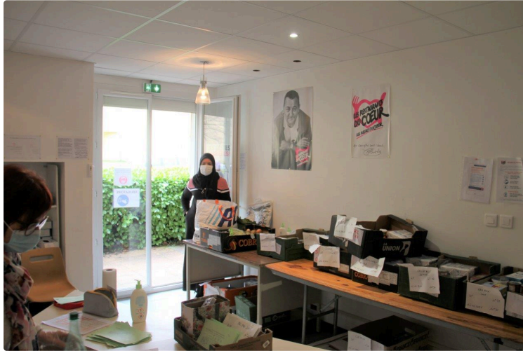
Un faux-plafond pour les Restos du Coeur

Dès qu'il sera posé, rien n'empêchera plus le déménagement vers un nouveau local bien mieux adapté