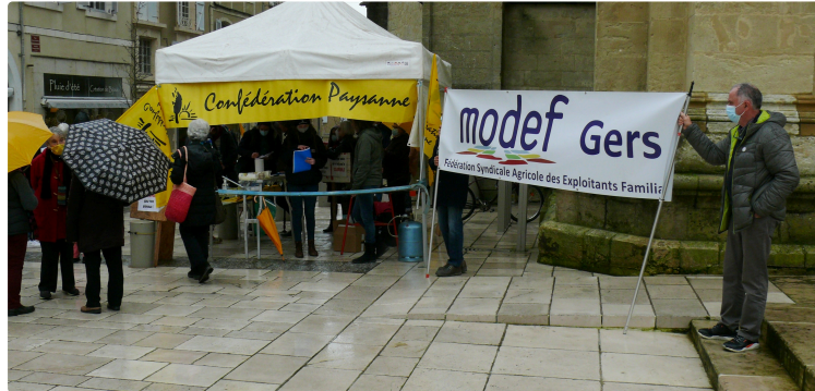
Trois syndicats agricoles et les enseignants du lycée et du collège de Mirande ont manifesté

Deux manifestations se sont tenues ce mercredi après-midi à Auch, l'une devant la préfecture à l'initiative de la Confédération paysanne, le Modéf, le GABB32, et l'autre devant l'inspection académique du Gers avec enseignants, parents et élèves du collège et lycée de Mirande.