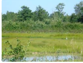
Balades nature pour petits et grands avec le CPIE Pays gersois !