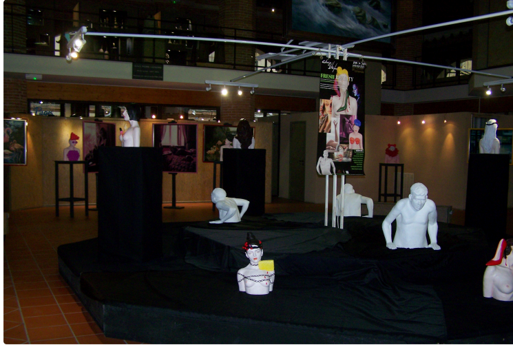
Au Musée d'Art Campanaire, une exposition installée mais sans public