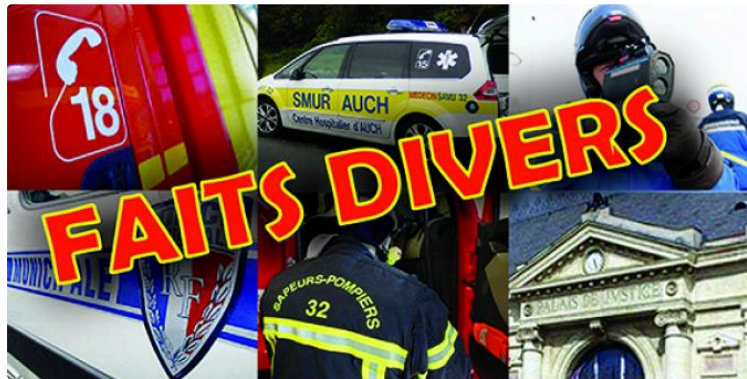
Gendarmerie du Gers : appel à témoins