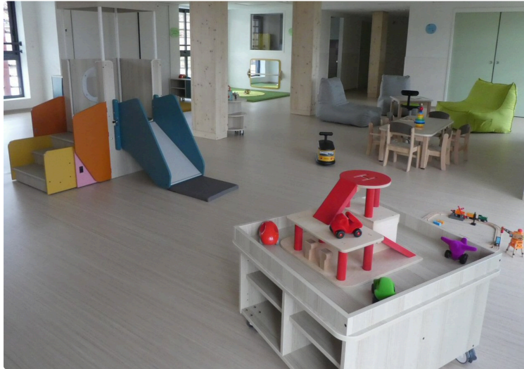
Un Lieu d'Accueil Enfants Parents accessibles pour les enfants jusqu'à 6 ans

Le lundi après-midi, au-dessus du Jardin d'Enfants