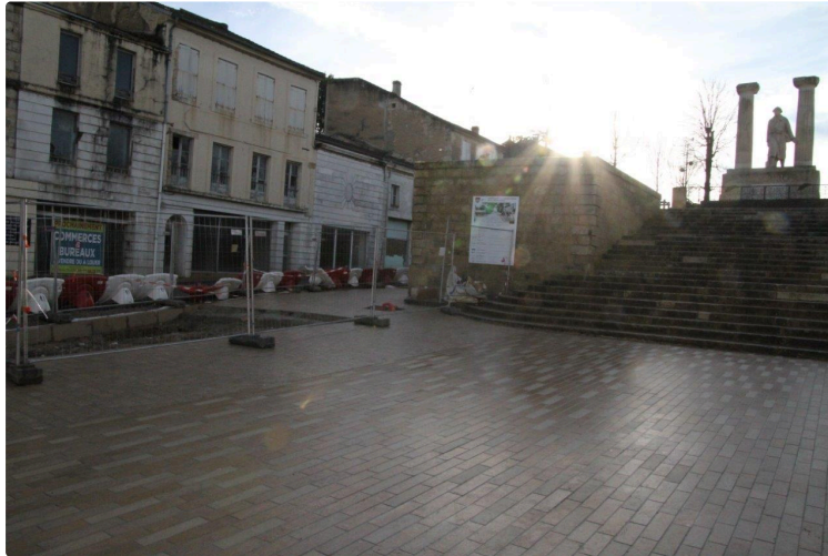
Une galerie commerciale, une première pour la ville