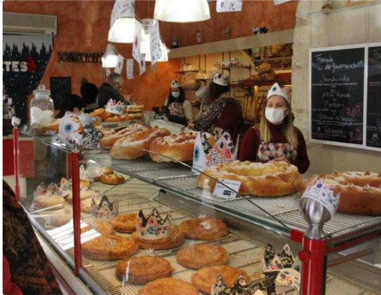
Ce dimanche 3 janvier, on fêtait l'Épiphanie

La tradition a été bien respectée et les clients se sont empressés de venir chercher une galette ou une couronne, chacun suivant ses préférences, couronne briochée ou galette à la frangipane.