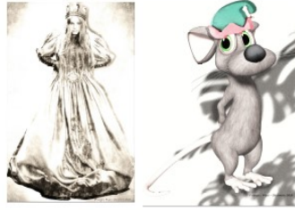
La fée, le lutin, la souris (suite et fin )