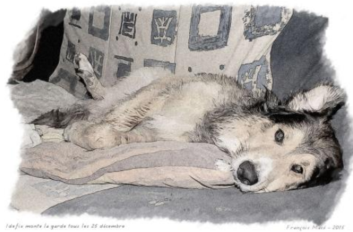
La fee monte la garde tous les 25 décembre