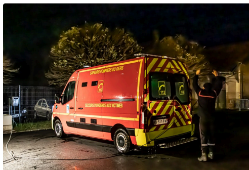
Le VSAV est soigneusement lavé...