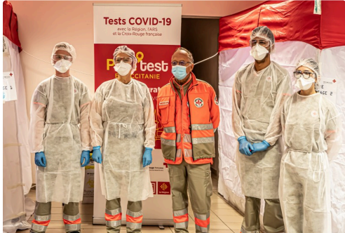
L'équipe de dépistage à Aignan