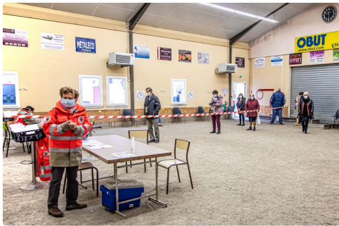
Accueil pour le test à Aignan