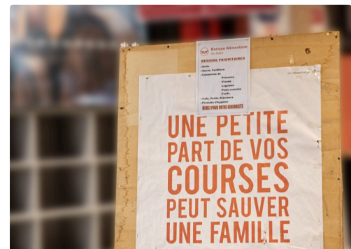
Affiche de la Banque alimentaire