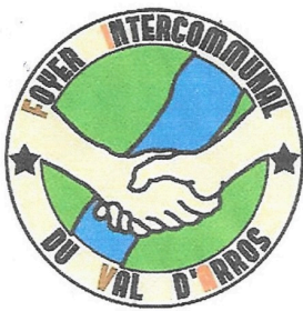
Logo FIVA journal.jpg

Nous comptons fortement cette année encore sur votre soutien malgré cette situation particulièrement difficile et remercions par avance tous les généreux donateurs qui pourront s'ils le souhaitent bénéficier de la déduction fiscale.