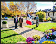
1 DR Christian Peyret 1bis 111120.JPG

N.B. - Les photos ont été communiquées par Christian Peyret.